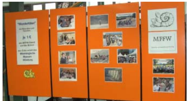
Stellwand mit Bildern aus dem Vereinsgeschehen.