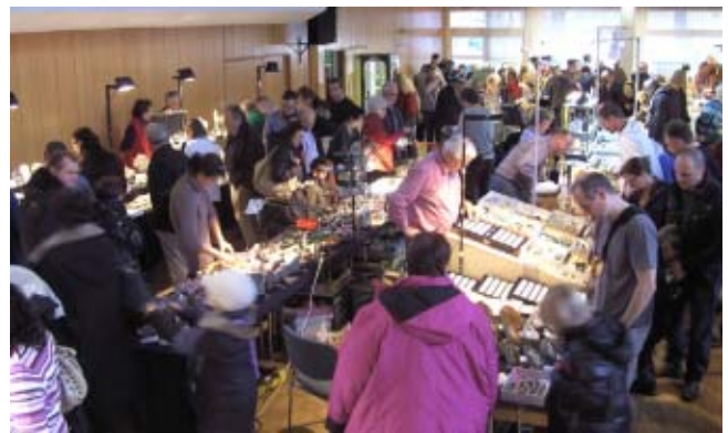
Blick in den Saal.